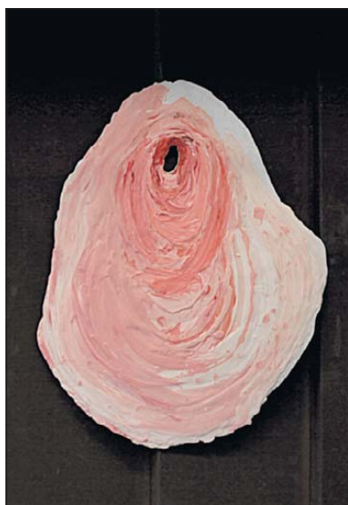
Werk van José Fijnaut.

Foto's van Linda Troeller completeren de expositie. Die laten weinig aan de verbeelding over. „Waar hang jij ergens?”, vroeg mijn moeder gekserend”, lacht José. „Mijn ouders hebben mij vrij opgevoed. Van jongs af aan werd thuis heel open over seks gesproken. Terwijl ik als enige in de klas nog wel in Sinterklaas geloofde.”